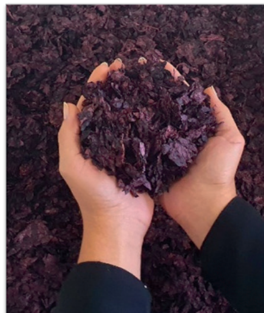
Fig. 1. Vinaccia di Aglianico

La valorizzazione di questo sottoprodotto è stata resa possibile grazie a diversi progetti finanziati dalla Regione Basilicata, tra cui ALIMINTEGRA, GO NUTRIBAS (misura PSR 16.1) e il progetto SPIA (PO FESR Basilicata 2014–2020), dedicati alla valorizzazione di prodotti del territorio nonché al recupero dei sottoprodotti agroalimentari. Queste iniziative hanno favorito una stretta collaborazione tra il mondo della ricerca e quello produttivo, coinvolgendo sia realtà accademiche di rilievo, come l'Università Federico II di Napoli, l'Università di Granada e l'Accademia delle Scienze della Repubblica Ceca, sia imprese storiche del territorio, come EVRA srl (Lauria, PZ) e Cantine del Notaio soc. agr. ar.l. (Rionero in Vulture, PZ). Questo approccio integrato ha permesso di disporre della materia prima necessaria per gli studi e rafforzare il legame tra innovazione, tradizione enologica e sviluppo locale.