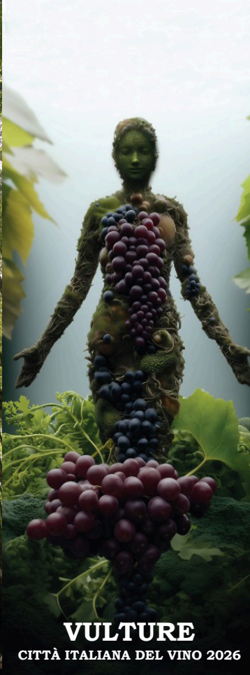
VULTURE CITTÀ ITALIANA DEL VINO 2026