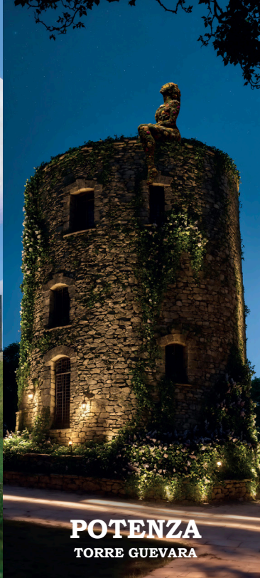
POTENZA TORRE GUEVARA