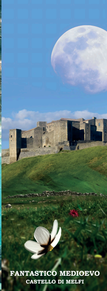
FANTASTICO MEDIOEVO CASTELLO DI MELFI